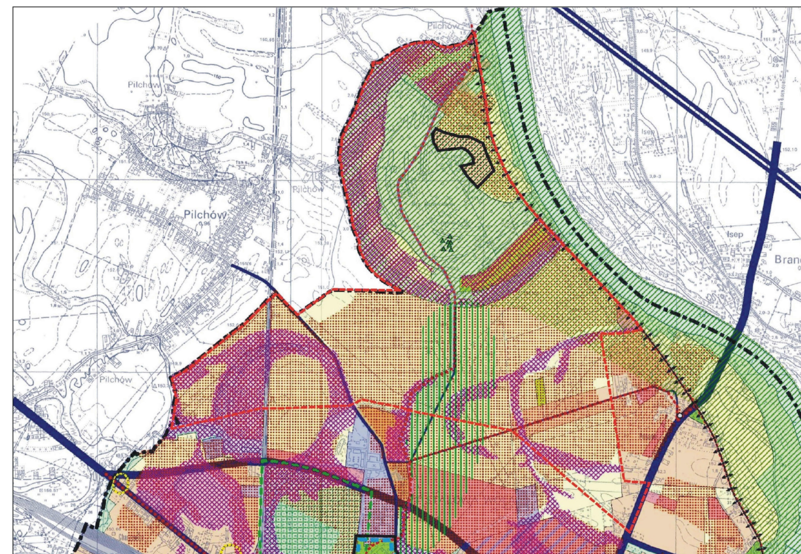
WYRYS ZE STUDYUM UWARUNKWAŃ I KIERUNKÓW ZAGOSPODAROWANIA PRZESTRZENNEGO GMINY STALOWA WOLA