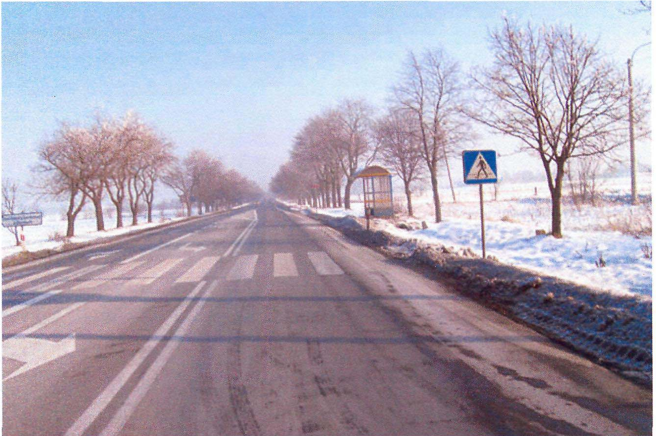
Zdjęcie nr 2: Droga krajowa nr 2 przebiegająca przez wieś Bramki