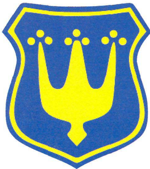
Herb Gminy Błonie