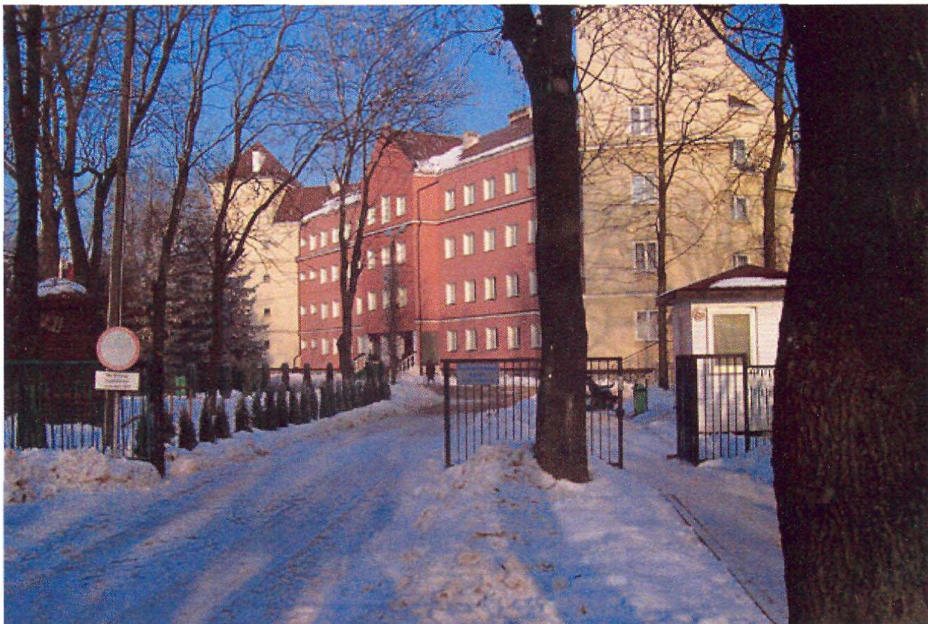
Zdjęcie nr 1: Dom Pomocy Społecznej we wsi Bramki

Niebagatelną rolę odgrywa także Dom Pomocy Społecznej. Położony w północnej części Bramek ośrodek jest z jednej strony miejscem pracy dla wielu mieszkańców, a z drugiej strony świadczy usługi z zakresu poradnictwa, opieki nad osobami starszymi i niezaradnymi życiowo, jest współorganizatorem warsztatów Terapii Zajęciowej.